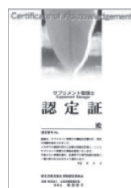
サプリメント管理士 認定証