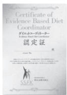
ダイエットコーディネーター 認定証