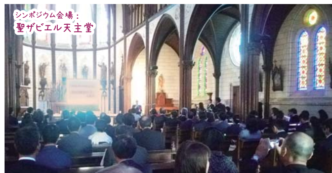
シンポジウム会場： 聖ガビエル天主堂