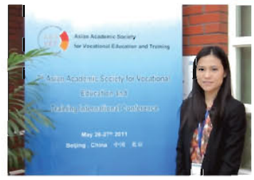
部会会場ポスター前にて