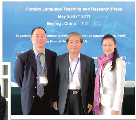
韓国技術教育学会 会長(中央)と記念撮影