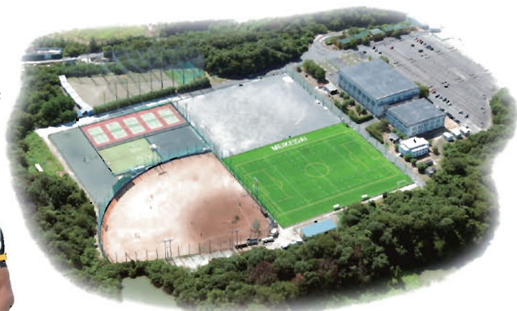
2011年8月 人工芝グラウンドへの改修工事完成

8月上旬に人工芝グラウンドが完成しました。早速、夏休みよりサッカー部、ラグビー部が公式戦や練習で使用しています。これにより、練習環境が整備され、今後より一層、課外活動の活性化が期待されます。