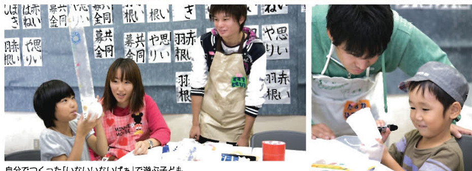
自分でつくった「いないいないばあ」で遊ぶ子ども