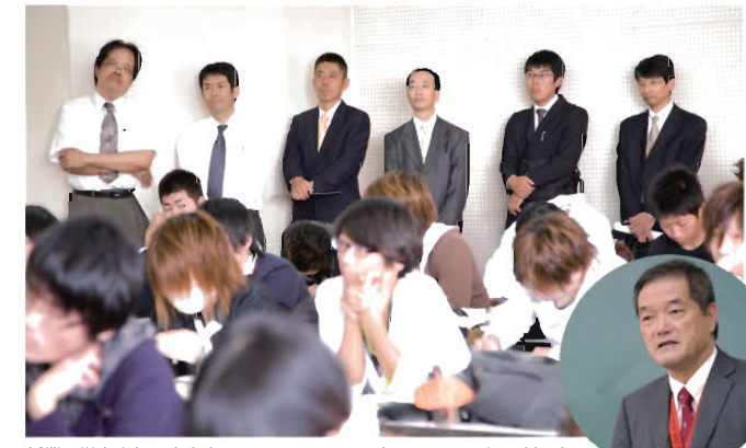
授業見学をされる先生方

という短い時間でしたが、高校の先生方にとってはなかなか経験できない有意義な研修会となったことと思います。