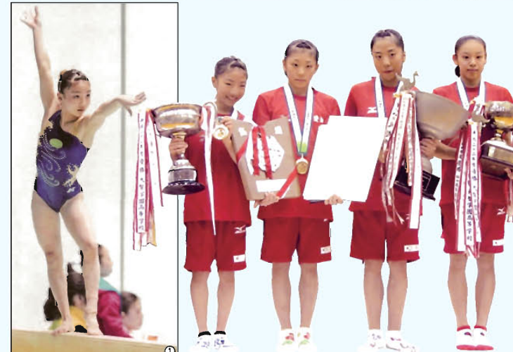
中日新聞 平成23年5月9日付(夕刊)掲載写真 ※中日新聞社の許諾を得て転載