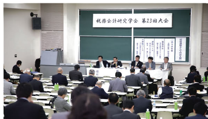
シンポジウム「所得課税としての法人税」

本大会を成功裏に終えることができたのは、学内および学外の多くの方々のご協力があったからです。受付、誘導、会場整理など、大会運営スタッフとして活躍してくれた本学在学学生や大学院OB・OGの皆さんの立ち居振る舞い・礼節について、大会に参加された諸先生方からお褒めの言葉をいた