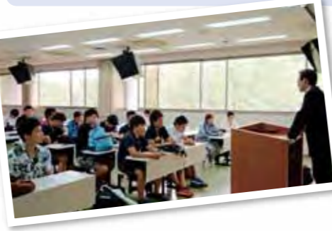
OBの話に聞き入る新入生