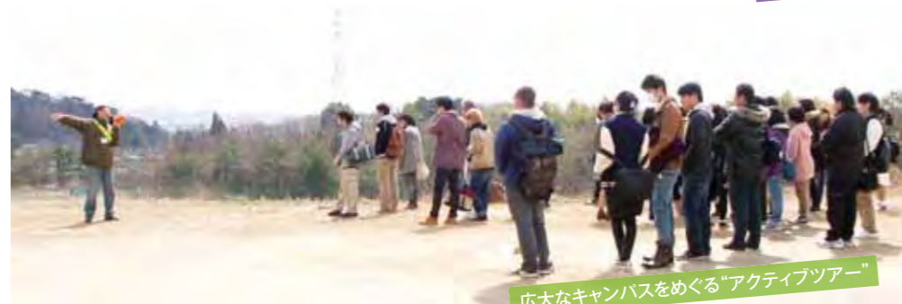
広大なキャンパスをめぐる「アクティブツアー」