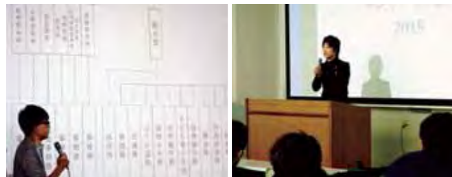
公務員の仕事について解説

5月16日(土)、上級生が企画する新入生を対象にした法学部伝統行事「フレッシュマンセミナー」を開催しました。今回は、名古屋市職員、司法書士、警察官など、4名のOBが大学生活やそれぞれの職業について講演。講演後は、他のOB・OGも参加して個別相談を行いました。