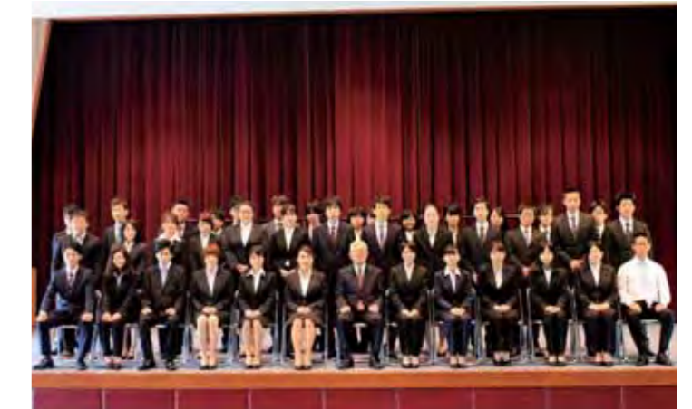
学長を囲んでにこやかな笑顔で「記念撮影」に収まる学生たち