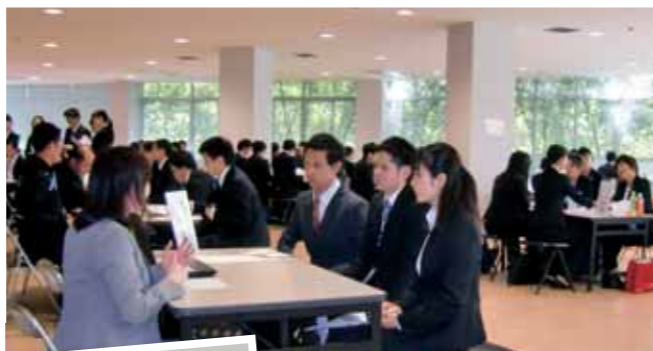
採用担当者からの説明に真剣に耳を傾ける学生たち

今年度より、学生の就職活動の解禁時期が3年生の12月から3ヶ月後ろ倒しの3月に変更されたこともあり、多くのブースでは採用担当者と学生双方が積極的にアピールを行う姿が見られ、会場は最後まで熱気に包まれていました。