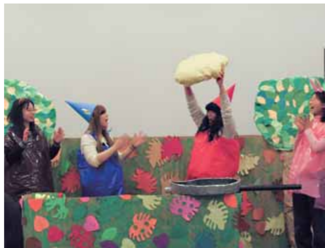
絵本「くりとぐら」の世界を人間劇で