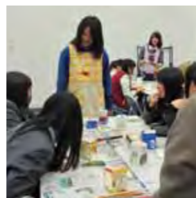
「箱カメラ」の作り方をレクチャー