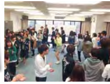
上級生を講師に「遊び」を体験する