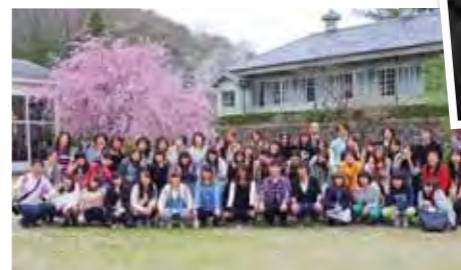
明治村の桜をバックに記念写真