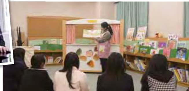
絵本ライブラリーで絵本の読み聞かせ