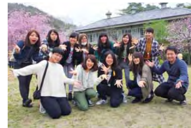
企画・運営をした「チーム保育科」2年生