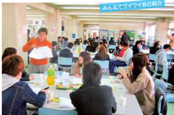
みんなでワイワイ自己紹介