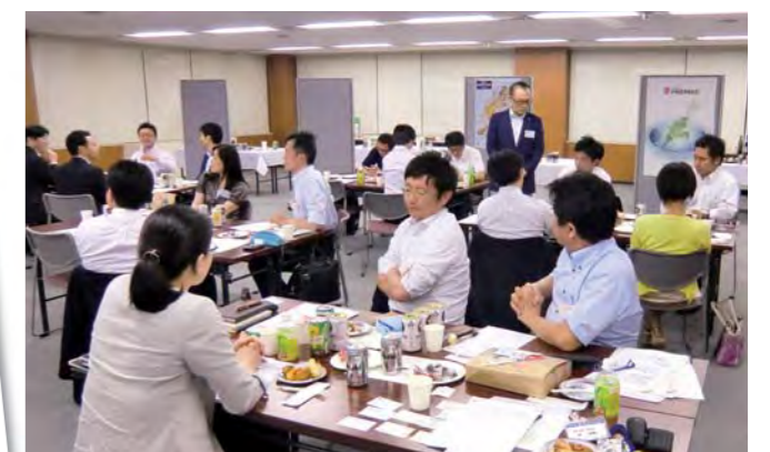
盛り上がるグループディスカッション

人々に驚きと感動を与える「イノベーション」です。そこで、我々の生活に馴染み深い画期的な商品のいくつかの事例を通して「イノベーション」について、知的好奇心が旺盛な社会人の方々と共に考えてみました! (経営学部准教授 徐誠敏)