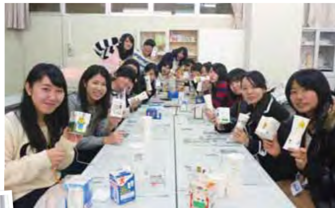
手づくりおもちゃを手に笑顔いっぱい