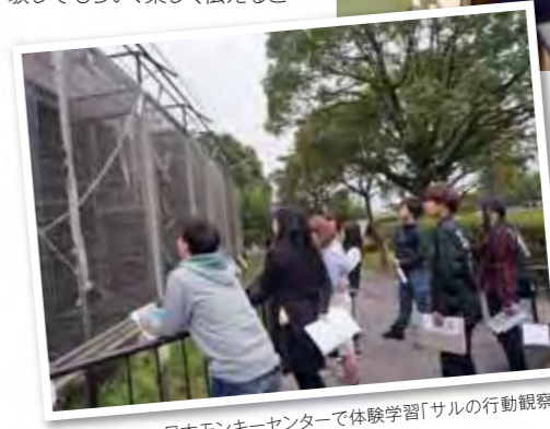
日本モンキーセンターで体験学習「サル」の行動観察