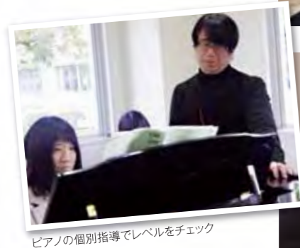
ピアノの個別指導でレベルをチェック