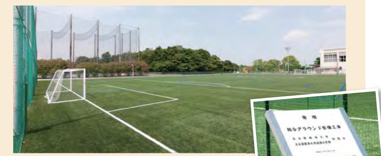
新設された第2人工芝グラウンドと記念の銘板(右)

大学・短大同窓会からお寄せいただいた寄附金により、サッカー・ラグビー場に隣接する土グラウンドが2015年4月、真新しい“人工芝グラウンド”に生まれ変わりました。愛知県で1部リーグ優勝を果たし、東海リーグ2部へ昇格した男子サッカー部と、新たに誕生した女子サッカー部のグラウンドとして使用されます。両チームのさらなる活躍に期待が寄せられています。