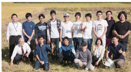
「名経米を作ろう!」この秋一番の青空が祝福! 学長とともに収穫を終え記念撮影