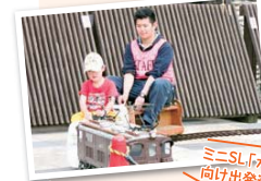
ミニSL「犬山城」へ向け出発進行!