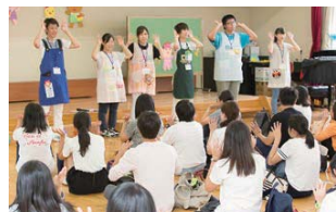
参加者と一緒に手遊びでリラックス

準備段階では、学年や組織を超えた連携や打ち合わせを入念に行い、学生たちは苦労しながらも、1・2年のリーダーを中心として事前の準備に取り組んでいました。