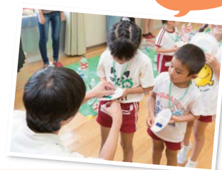
ゲームいくつクリアできたかな?

当日は、子どもたちの楽しむ様子がうかがえ、参加した高校生からも「楽しかった」「子どもたちが可愛かった」など、さまざまな感想を聞くことができました。実践後の学生からは、反省の声が多く聞かれましたが、こうした経験は、必ず学生の教師力となります。それぞれの反省は今後の教育・保育者としての生涯の学びに繋がるものと信じています。