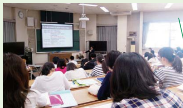
2日目の筆記試験に備え真剣に講義を聴講する学生たち