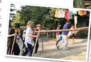
「尾張富士 大宮浅間神社」へ向け列をなして元気に出発!