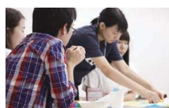
それぞれの意見を付箋に書きまとめる

少子高齢化による人口減少が現実的な課題となる中、「大学や学生ができることは何か?」「果たすべき役割は?」といった難しいテーマに対して、教職員や学生同士で真剣かつ前向きに議論を深めました。このような機会を通してさまざまなアイデアを行政に届け、地域と大学とのコラボレーションが始まることを期待しています。（横平）