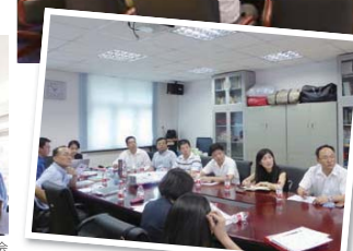
華東政法大学司法鑑定センター