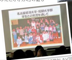
ボランティア活動の様子を紹介したVTR