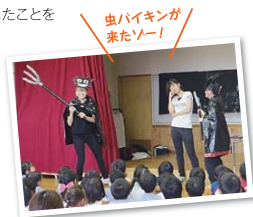
虫バイキングが来たゾー!