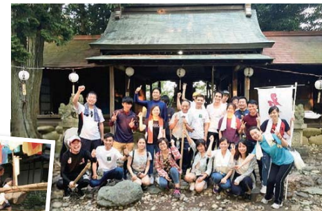
尾張富士の山頂にて、無事に奉納を終え元気に記念撮影

8月7日(日)、尾張富士大宮浅間神社で行われた「石上げ祭」に学生、教職員合わせて26名が参加しました。体験型プロジェクト「犬山の観光戦略を考える」との連携もあり、本科目の履修生たちは事前に石上げ祭伝承保存会の方々から祭の由来や意義などについて講義を受け、「石上げ祭」に臨みました。初めて参加する学生が多く、はじめは上手くいかないこともありましたが、石上げ祭伝承保存会の方々と一緒に参加している地域の皆さんにかけ声や歌でサポートをしていただき、一致団結して無事奉納を果すことができました。