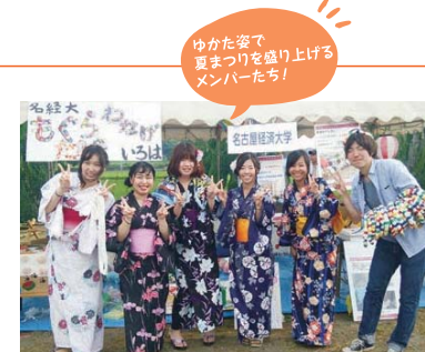
ゆかた姿で夏まつりを盛り上げるメンバーたち!