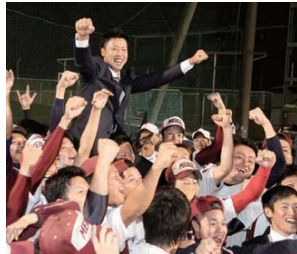
ドラフト当日、チームメイトからの祝福を受ける

まず、指名してくださった東京ヤクルトスワローズに感謝しています。そして、ここまで自分を育ててくれた母親や野球の指導をしてくださった方々に感謝の気持ちでいっぱいです。