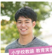
小学校教諭 教育実習