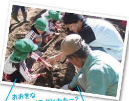
お好きなサツマイモがとれたー?