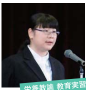
栄養教諭 教育実習