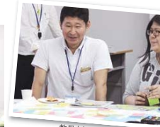
教員も加わり意見の交換をする