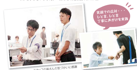
スタッフの皆さんの気づかいに感謝