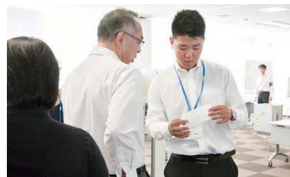
投票用紙を確認し、次の場所へご案内

6月27日(月)~29日(水)と7月1日(金)~3日(日)、犬山市選挙管理委員会のご協力により、7月10日参議院議員通常選挙・期日前投票実務体験に23名の学生が参加しました。事前に選挙管理委員会事務局の職員から選挙や投票所の仕組み・担当の業務内容などの説明を受けた後、案内係・投票用紙交付係を役割分担し、実務体験することができました。